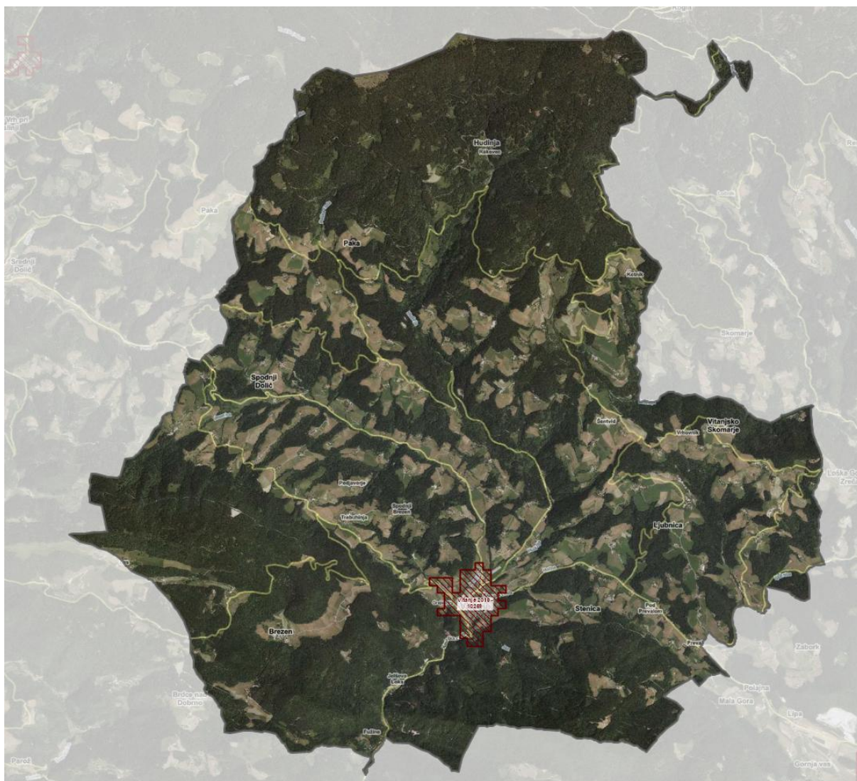
Slika 3: Prikaz aglomeracij v občini Vitanje.